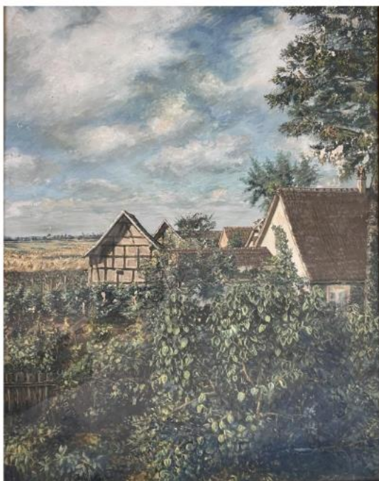
Jardin, tempéra, 1898, 64x48, collection particulière