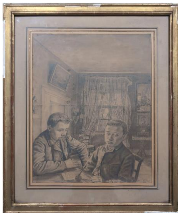
La lettre, dessin au crayon, 1893, Hôtel des ventes des notaires