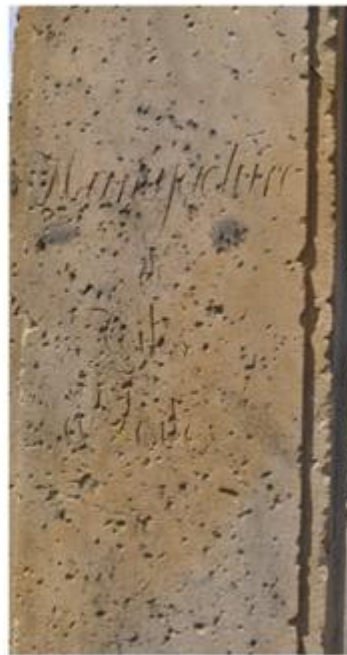
Manufacture de toiles à voiles