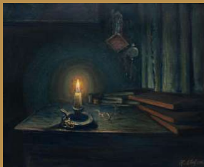
Chandelle sur table - 1906 tempera sur carton, 51 X 62 cm