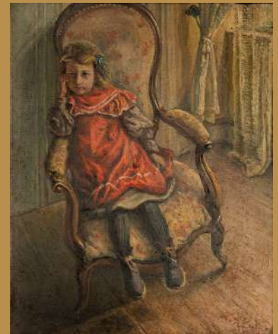
Rosalie Marie, la petite nièce dans un fauteuil - 1909 tempera, 28 X 35 cm © Collection particulière