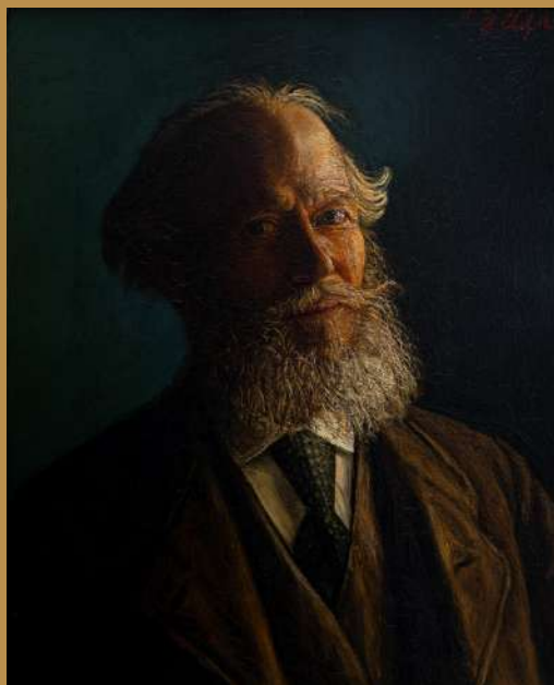
Henri Ebel, Autoportrait - 1918 huile sur toile, 73x64 cm