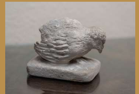
Poussin Sculpture, plâtre © Collection particulière