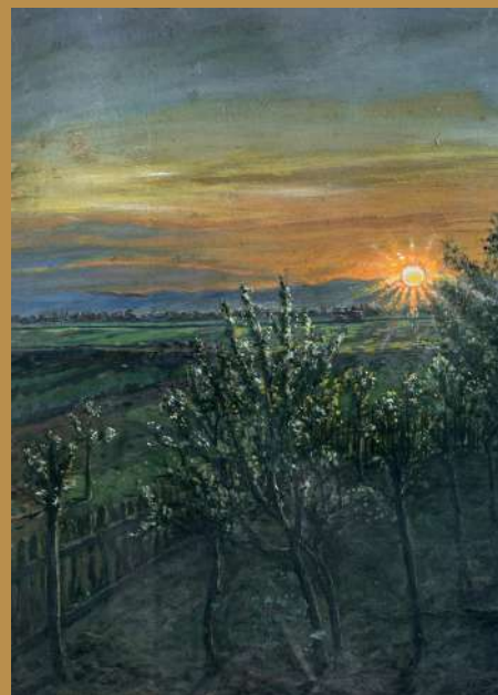
Coucher de soleil sur le jardin - 1899 tempera sur carton