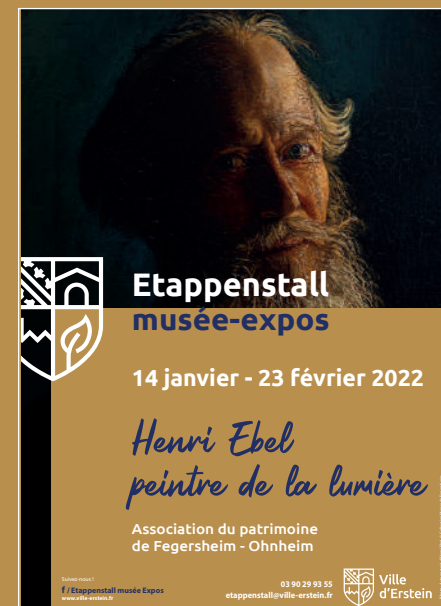
Affiche de l'exposition © Ville d'Erstein

L'ensemble des visuels sont disponibles sur demande auprès de l'Etappenstall pour une utilisation exclusivement pendant la période de l'exposition. © Tous droits réservés.