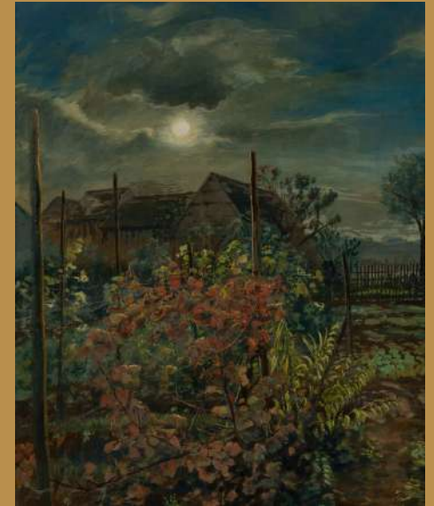
Jardin du peintre tempera, 97 X 75 cm

Un ouvrage monographique prolonge la découverte de l'exposition.