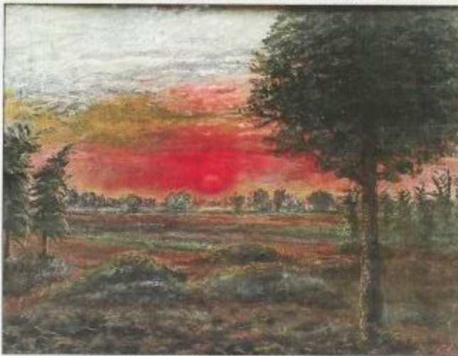
Un coucher de soleil, comme l'artiste les affectionnait, peint à la tempera en 1911.