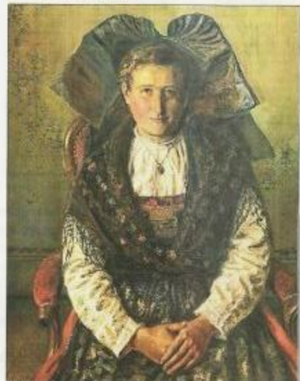
L'Alsacienne, une tempera datée de 1916.