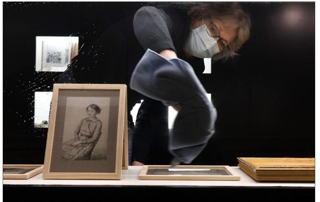
Les bénévoles de l'Association de sauvegarde du patrimoine de Fegersheim-Ohnheim procèdent actuellement à l'installation de l'exposition consacrée à Henri Ebel.

L'Etappenstall n'en finit pas de surprendre ! Après Gainsbourg, place à la première exposition monographique contemporaine consacrée à Henri Ebel, dit le « maître de Fegersheim ». Une proposition permise grâce au travail de l'Association de sauvegarde du patrimoine de Fegersheim-Ohnheim.