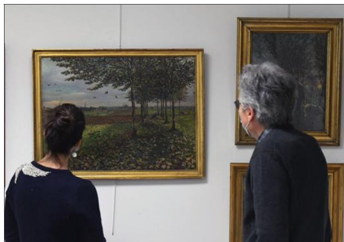
Une exposition à découvrir à partir du 14 janvier.

Arrêt Boulevard des Enseignes Lignes 6, 71, 74, 75